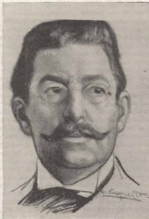
José Enrique Rodó

Su obra literaria es un modelo de dicción moderna y castiza a un tiempo mismo, tan hermosa por la forma impecable en que hace lucir las galas del idioma cual joyas de preciado valor, como intensa y eminente por el fondo útil, por el fin noble a que de continuo tendía la pluma segura y admirable de aquel mago del estilo, guiada sin cesar por una mano experta que recibía siempre su impulso del corazón y lo regulaba con el cerebro, con aquel su poderoso cerebro cuyas clarísimas luces fueron a extinguirse lejos de la tierra nativa y entre los resplandores del incendio inmenso cuyos estragos pudo Rodó ver de cerca en Europa. No sabíamos que antes viajara sino a Chile; y las impresiones de éste su primero y único viaje fuera de América han sido maravillosamente descritas por